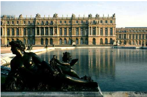
Reggia di Versailles

(France), Repubblica ( République Française ) dell'Europa occidentale. Superficie: 543.965 km 2 .