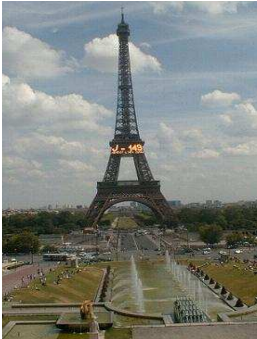
Figura 1- Torre Eiffel (1889)

“Verso mezzodi si scorge la torre Eiffel. Si passa così vicino a Parigi, scoprendolo nella sua grande immensità. Non si attraversa perché hanno paura del santo colera.”