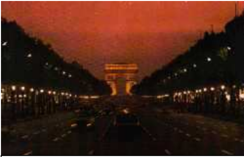
Champs Elvèsès e Arc de Trionphe