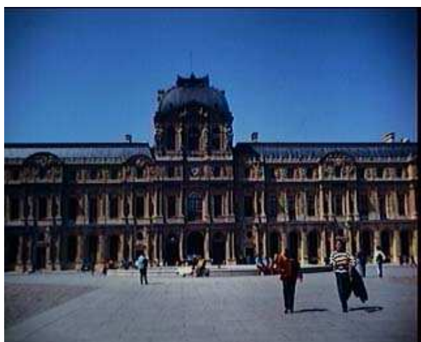
Figura 3 - Museo del Louvre