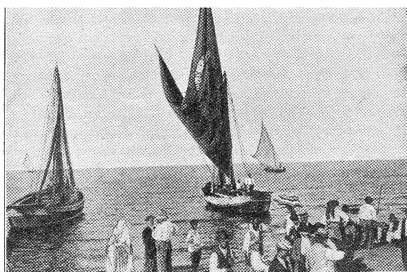
FRANCAVILLA AL MARE. — Barche da pesca.