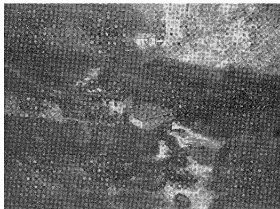
Il mulino dell'Aterno con l'Eremo in fondo tra la forra di Colle Mentino e Monte Urano.