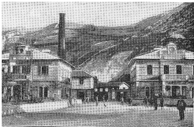
Bussi. — Ingresso alle officine: Stabilimento elettro-chimico.

Nelle seguenti immagini si vedono lo Stabilimento di Bussi, Il mulino presso S. Venanzio, alcuni mezzi di trasporto e una scena di pesca ai tempi di Umberto Postiglione.