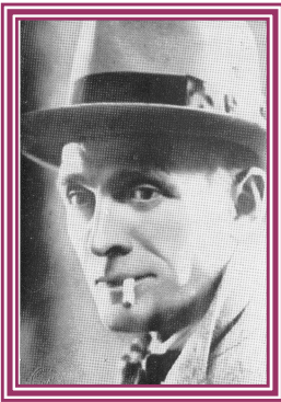
Modesto Della Porta Guardiagrele (CH), 1885 Roma, 1938