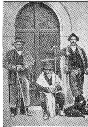
CASTEL DEL MONTE. — Gruppo di pastori.